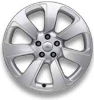
20" MIT 7 SPEICHEN (STYLE 7020) 1, 2 SPARKLE SILVER