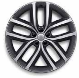
22" MIT 5 DOPPELSPEICHEN (STYLE 5127) 1 SATIN DARK GREY CONTRAST, DIAMOND TURNED Serienausstattung für Autobiography