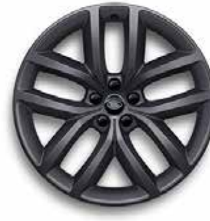
22" MIT 5 DOPPELSPEICHEN (STYLE 5127) 1 SATIN DARK GREY Serienausstattung für Dynamic HSE