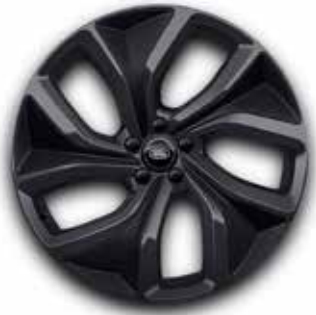
23" MIT 5 DOPPELSPEICHEN (STYLE 5128) 1 DARK GREY, CARBON INSERTS