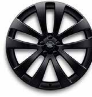
23" MIT 5 DOPPELSPEICHEN (STYLE 5135) 2 GLOSS BLACK