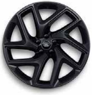
22" MIT 5 DOPPELSPEICHEN (STYLE 5131) 1 SATIN BLACK, GLOSS BLACK CONTRAST