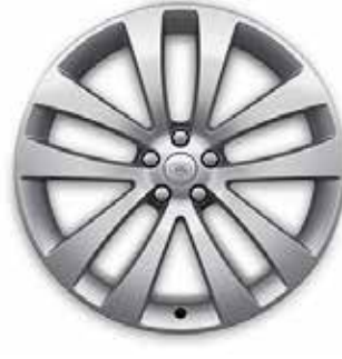
23" MIT 5 DOPPELSPEICHEN (STYLE 5135) 3 SPARKLE SILVER