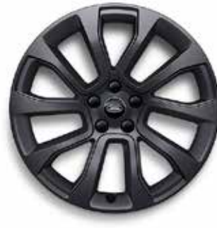
21" MIT 5 DOPPELSPEICHEN (STYLE 5126) 1 SATIN DARK GREY Serienausstattung für Dynamic SE