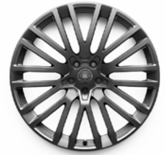
23" MIT 10 DOPPELSPEICHEN (STYLE 1084) 2 POLISHED DARK GREY, GESCHMIEDET Serienausstattung für Edition Two