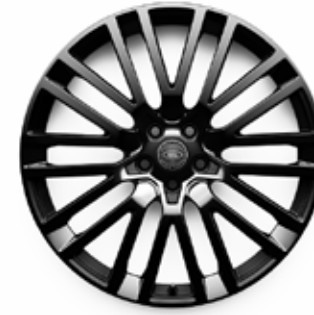
23" MIT 10 DOPPELSPEICHEN (STYLE 1084) 2 DUO TONE SATIN/GLOSS BLACK, GESCHMIEDET