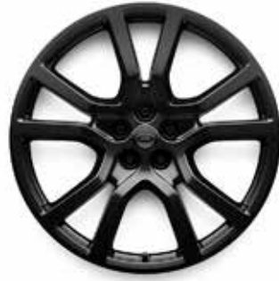
23" MIT 5 DOPPELSPEICHEN (STYLE 5132) 2 KARBON IN GLOSS DARK TINT