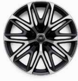
22" MIT 10 DOPPELSPEICHEN (STYLE 1083) 2 SATIN DARK GREY CONTRAST, DIAMOND TURNED