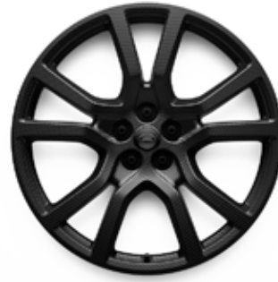
23" MIT 5 DOPPELSPEICHEN (STYLE 5132) 2 KARBON IN SATIN GREY TINT