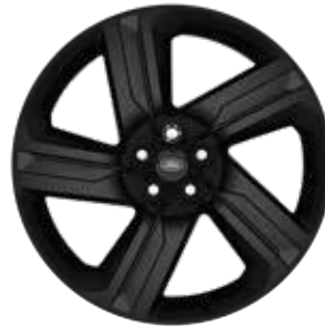
22" MIT 5 DOPPELSPEICHEN (STYLE 5124) GLOSS BLACK Serienausstattung für Dynamic HSE