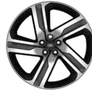
22" MIT 5 DOPPELSPEICHEN (STYLE 5124) 2 GLOSS DARK GREY, CONTRAST DIAMOND TURNED Serienausstattung für 35 th Anniversary Edition