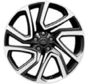
22" MIT 5 DOPPELSPEICHEN (STYLE 5025) SATIN DARK GREY, CONTRAST DIAMOND TURNED