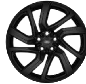
21" MIT 5 DOPPELSPEICHEN (STYLE 5025) GLOSS BLACK Serienausstattung für Dynamic SE