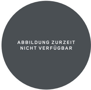
ABBILDUNG ZURZEIT NICHT VERFÜGBAR