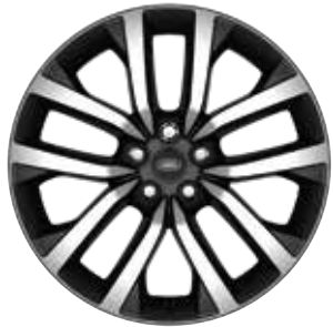
21" MIT 5 DOPPELSPEICHEN (STYLE 5123) 2 GLOSS DARK GREY, CONTRAST DIAMOND TURNED