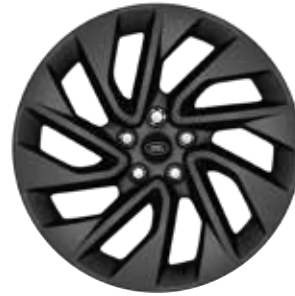
20" MIT 5 DOPPELSPEICHEN (STYLE 5122) 2 SATIN DARK GREY