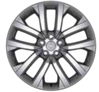
21" MIT 5 DOPPELSPEICHEN (STYLE 5123) 3 GLOSS SILVER