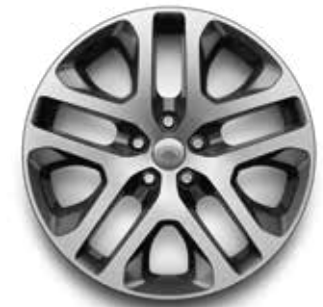
20" (STYLE 5095) 2,4 GLOSS DARK GREY MIT KONTRASTLACKIERUNG IN DIAMOND TURNED