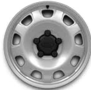
20" (STYLE 9013) 2,10 GLOSS WHITE