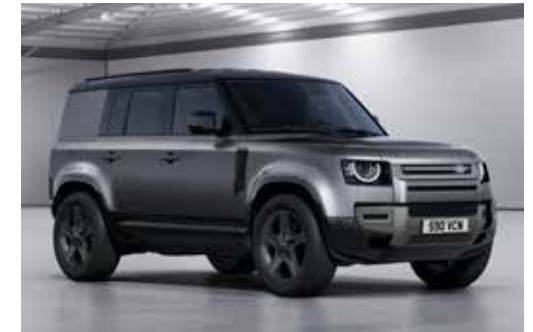
DEFENDER 110 HARD TOP X-DYNAMIC SE