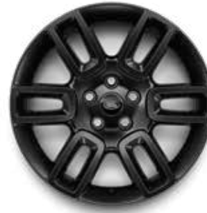
19" (STYLE 6010) 2,3 GLOSS BLACK