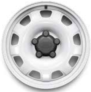
18" (STYLE 5093) 1 GLOSS WHITE AUS STAHL