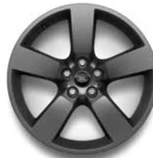
20" (STYLE 5098) 2,5,6 SATIN DARK GREY Serienausstattung für X-Dynamic HSE