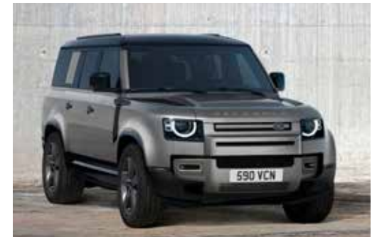
DEFENDER 130 X-DYNAMIC HSE