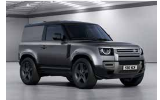
DEFENDER 90 HARD TOP X-DYNAMIC SE