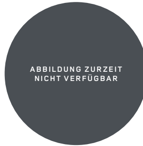
22" (STYLE 7026) 2,7,11 DIAMOND TURNED WITH GLOSS BLACK CONTRAST