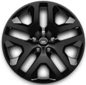
20" (STYLE 5095) 2,9 GLOSS BLACK Serienausstattung für Outbound