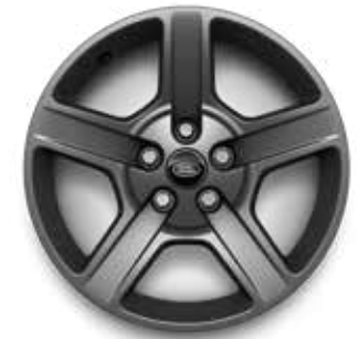
20" (STYLE 5094) 2,4 SATIN DARK GREY Serienausstattung für X-Dynamic SE und Hard Top X-Dynamic SE