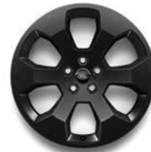
20" (STYLE 6011) 2,7,8 GLOSS BLACK