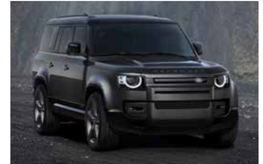
DEFENDER 130 V8