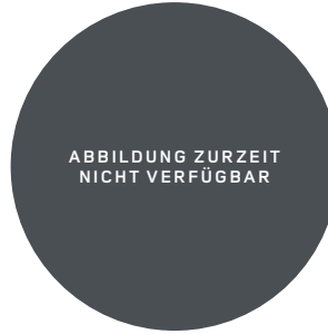
20" (STYLE 1086) 2,11,12 DIAMOND TURNED SATIN DARK TINT MIT KONTRASTLACKIERUNG IN SATIN BLACK Serienausstattung für OCTA Edition One