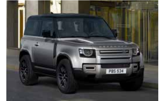
DEFENDER 90 X-DYNAMIC SE