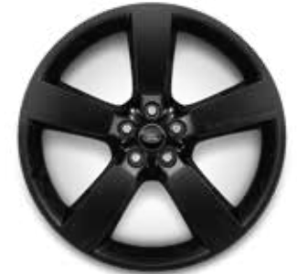
22" (STYLE 5098) 2,7,13,14,15 GLOSS BLACK Serienausstattung für Sedona Edition