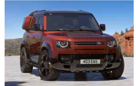
DEFENDER 110 SEDONA EDITION

Das abgebildete Fahrzeug dient nur zur Veranschaulichung und kann über Sonderausstattungen verfügen. Weitere Informationen zu Sonderausstattungen und deren Verfügbarkeit erhalten Sie von Ihrem Land Rover Partner.