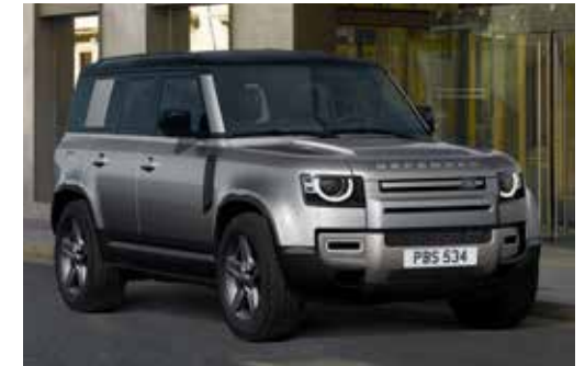
DEFENDER 110 X-DYNAMIC SE