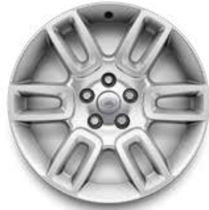
19" (STYLE 6010) 2,3 GLOSS SPARKLE SILVER Serienausstattung für S und Hard Top S