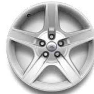
20" (STYLE 5094) 2,4 GLOSS SPARKLE SILVER