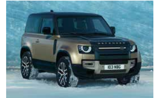
DEFENDER 90 X