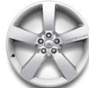
22" (STYLE 5098) 2,7,13,14 GLOSS SPARKLE SILVER Serienausstattung für X