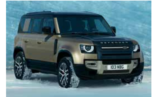
DEFENDER 110 X