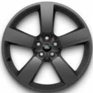
22" (STYLE 5098) 2,7,13,14,16 SATIN DARK GREY Serienausstattung für V8