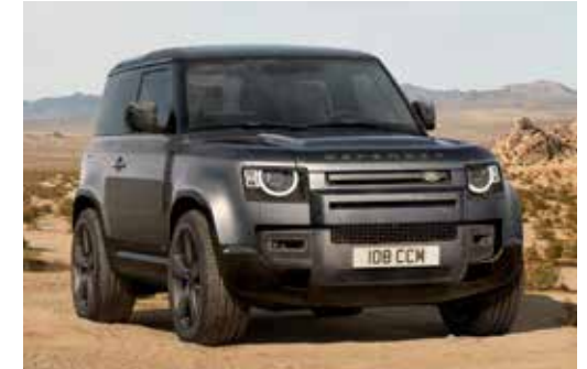
DEFENDER 90 V8