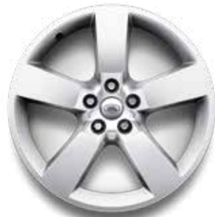
20" (STYLE 5098) 2,4,5 POLISHED SILVER