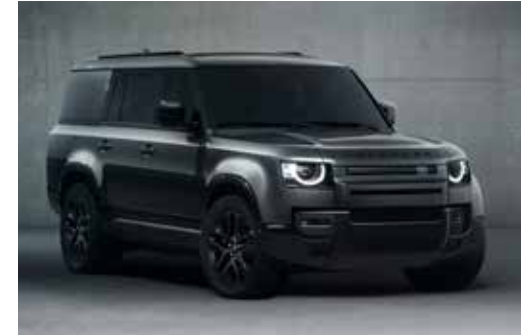
DEFENDER 130 OUTBOUND

Bitte beachten Sie, dass Serienausstattung eventuell durch gewählte Sonderausstattung ersetzt wird.