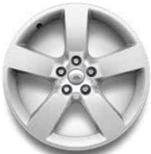
20" (STYLE 5098) 2,4 GLOSS SPARKLE SILVER