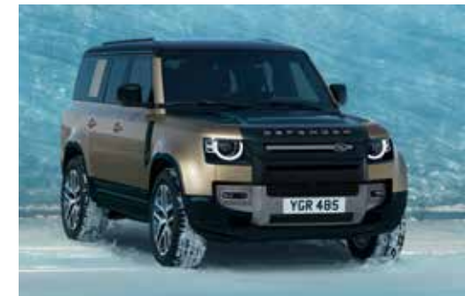
DEFENDER 130 X