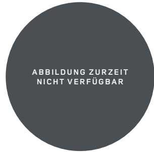
22" (STYLE 7026) 2,7,11 GLOSS BLACK Serienausstattung für OCTA